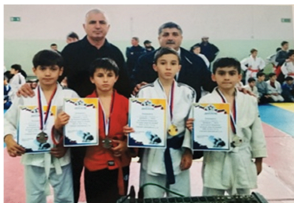
Фрюгъярин гъулаъ 2004-2006-пи; 2007-2008-пи; 2009-2019-пи; 2011-2012-пи йисари

2019-пи йисан 1-пи декабрь Цийи бабкан гъахь живанарин арайиъ дзюдойиан